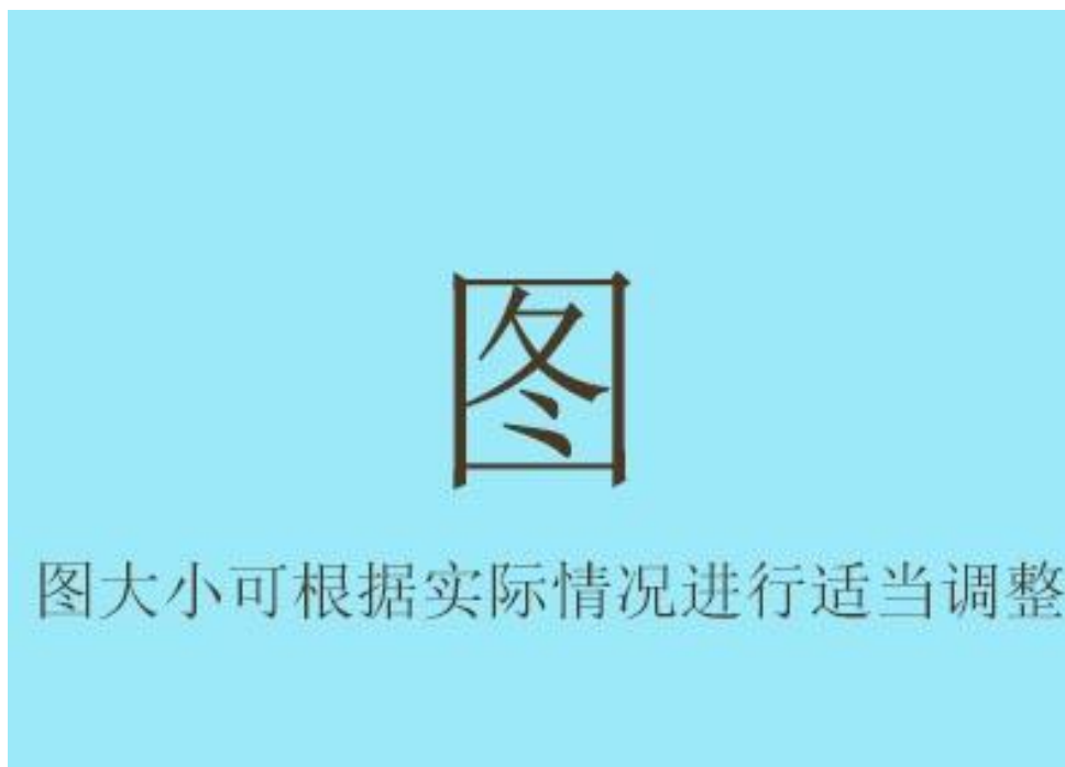
图 3.1 草图一